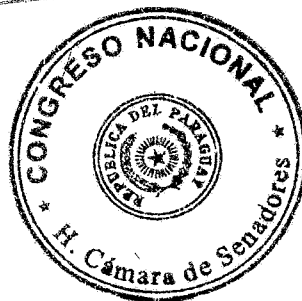
Fernando Lugo Méndez Presidente H. Cámara de Senadores